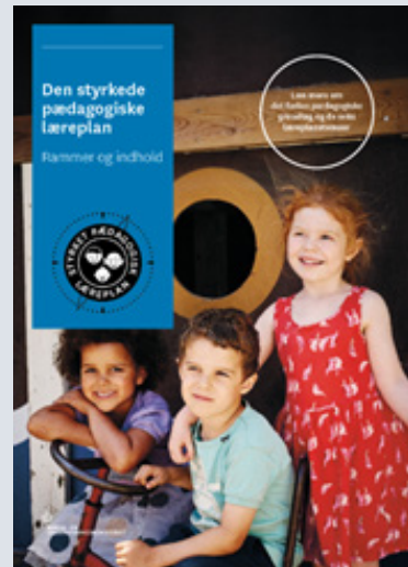
Den styrkede pædagogiske læreplan, Rammer og indhold

Denne skabelon indeholder alle de lovmæssige krav til evalueringen.